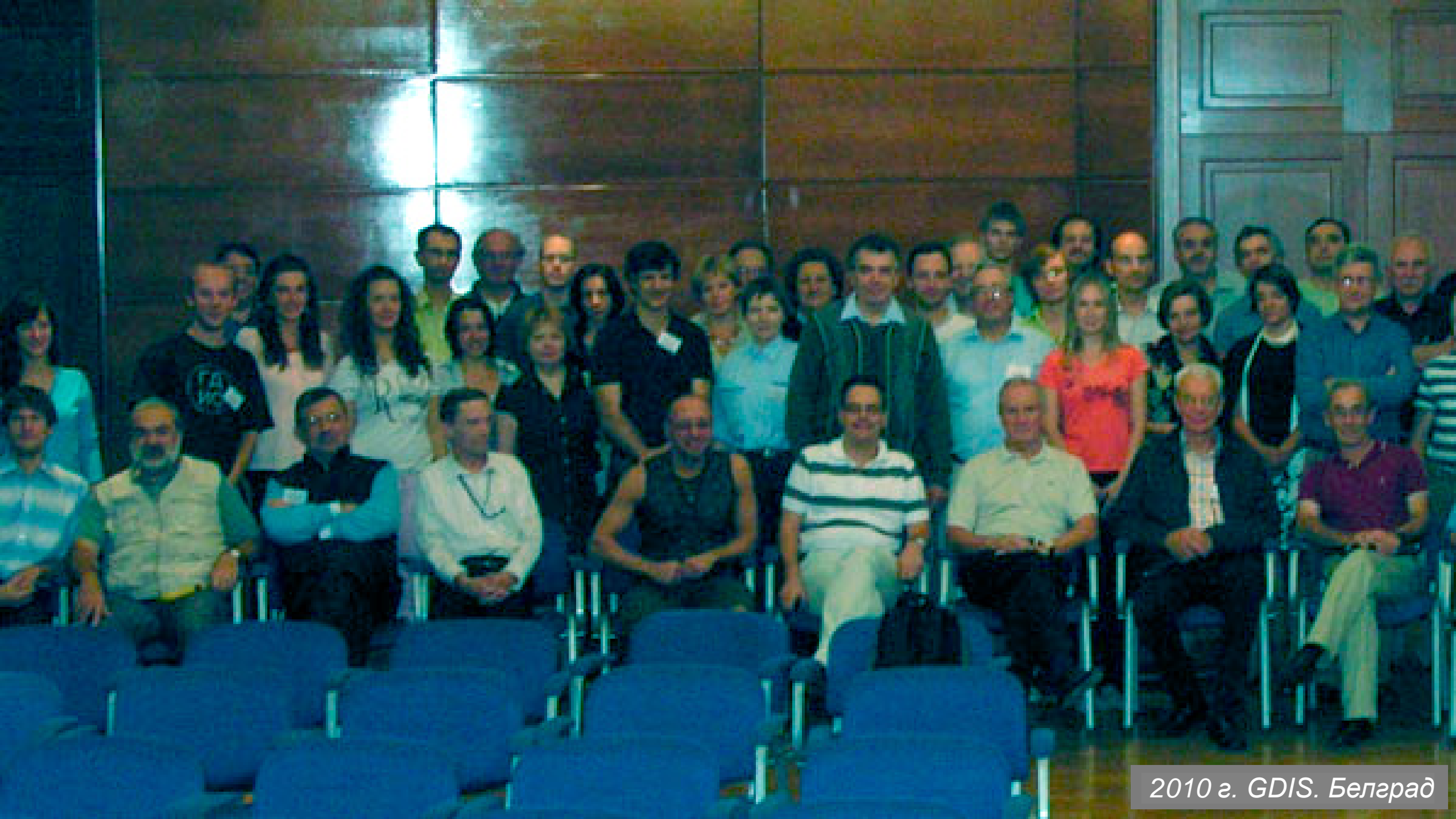
2010 г. GDIS. Белград