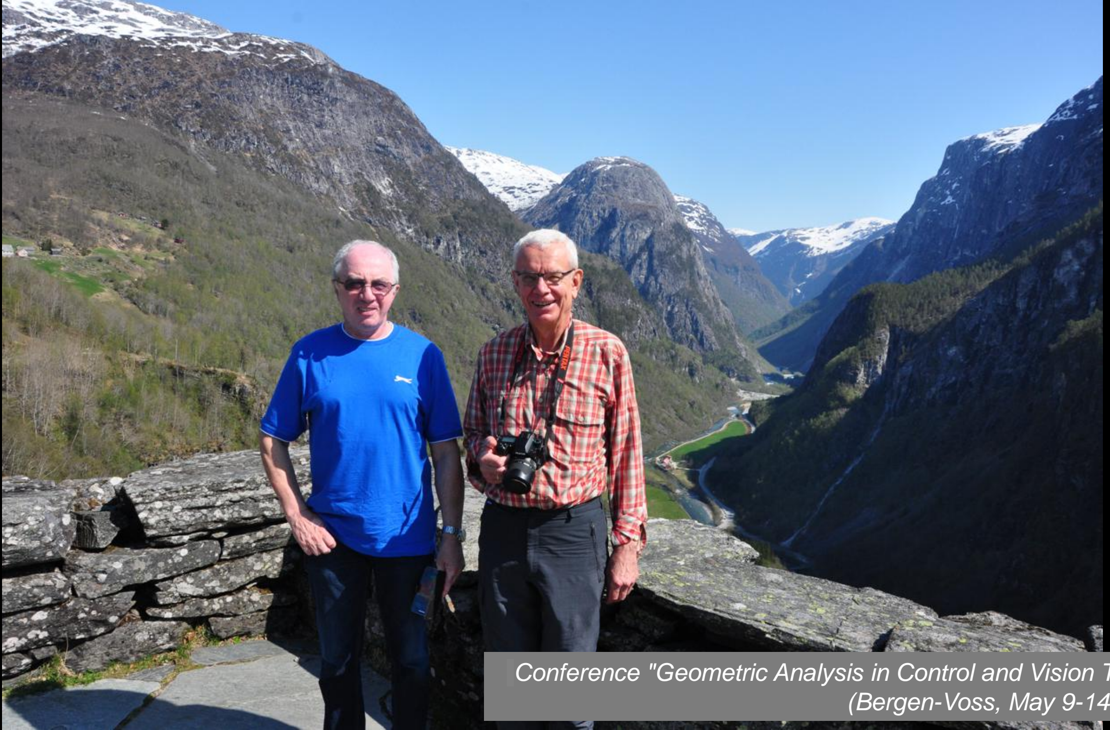
Conference "Geometric Analysis in Control and Vision Theory" (Bergen-Voss, May 9-14, 2016)