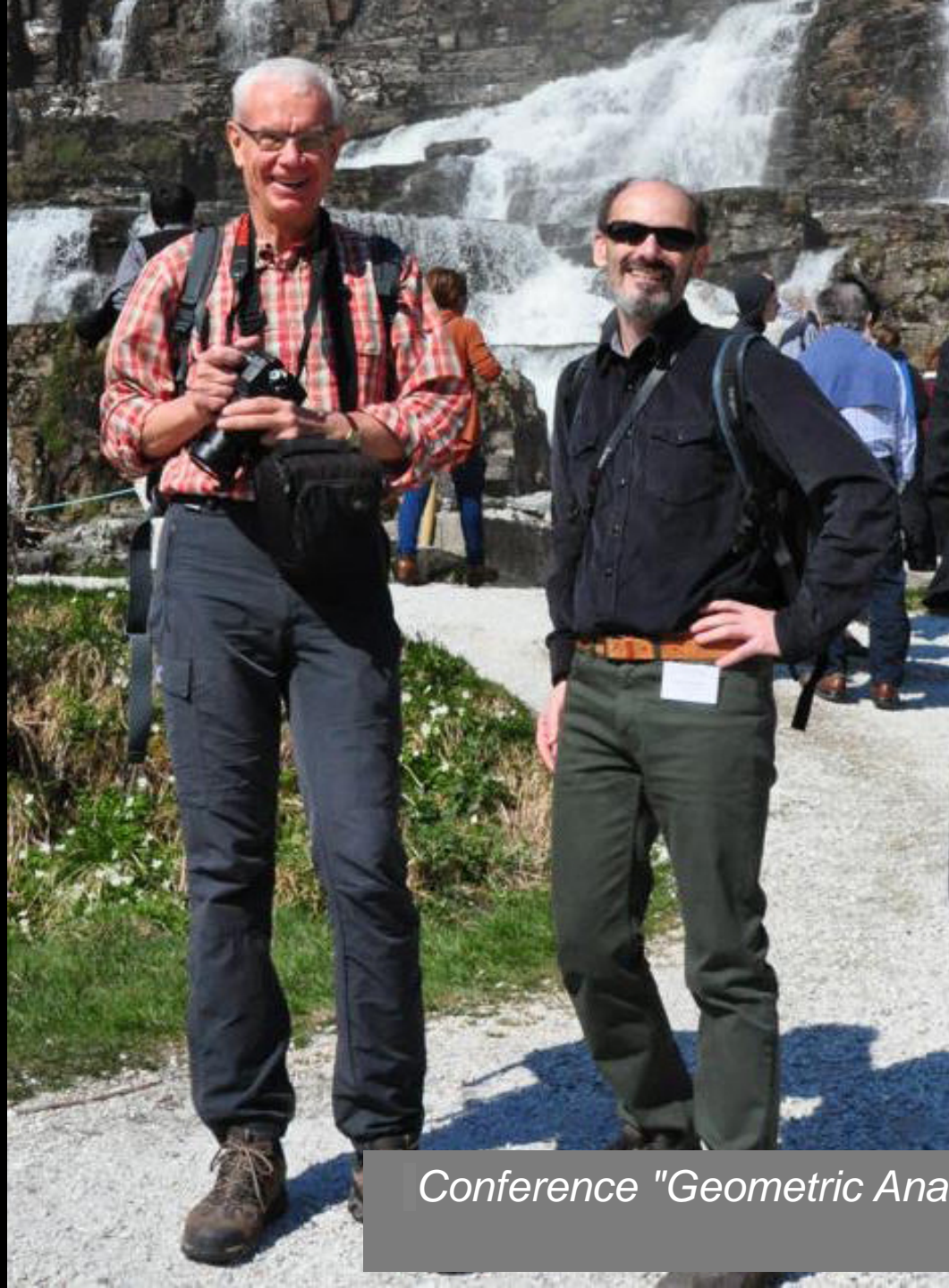
Conference "Geometric Analysis in Control and Vision Theory" (Bergen-Voss, May 9-14, 2016)