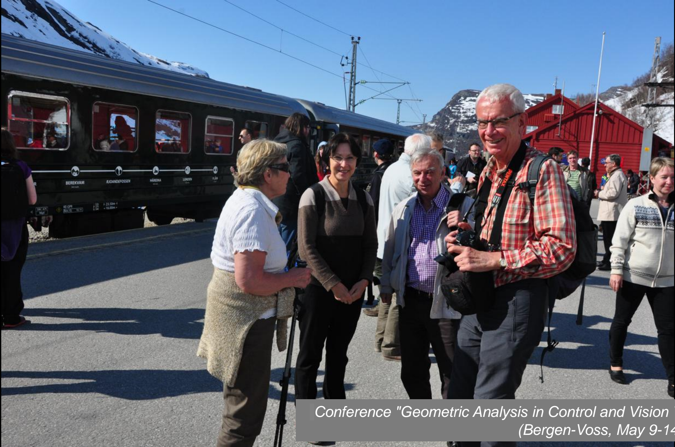
Conference "Geometric Analysis in Control and Vision Theory" (Bergen-Voss, May 9-14, 2016)