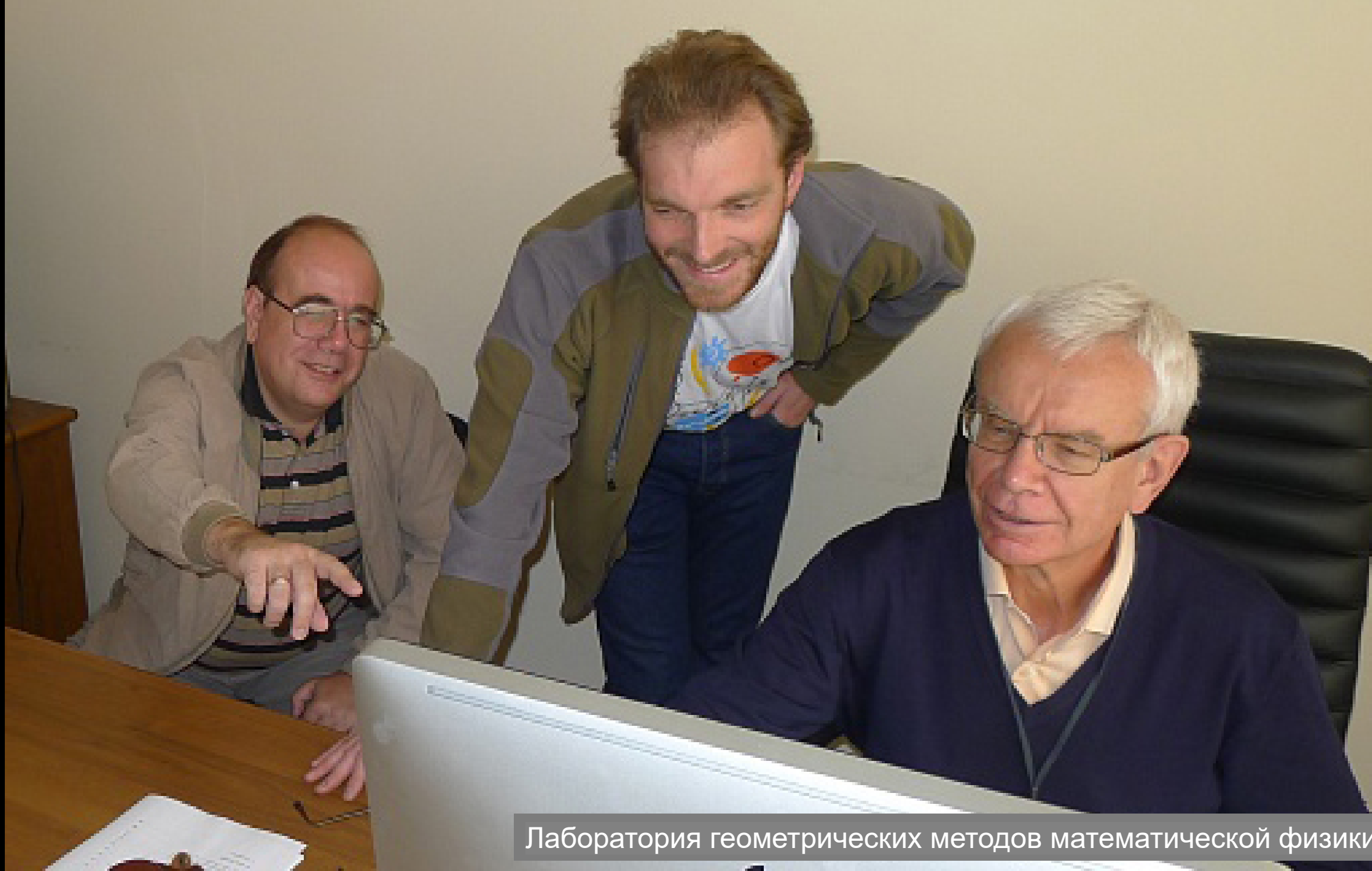
Лаборатория геометрических методов математической физики МГУ