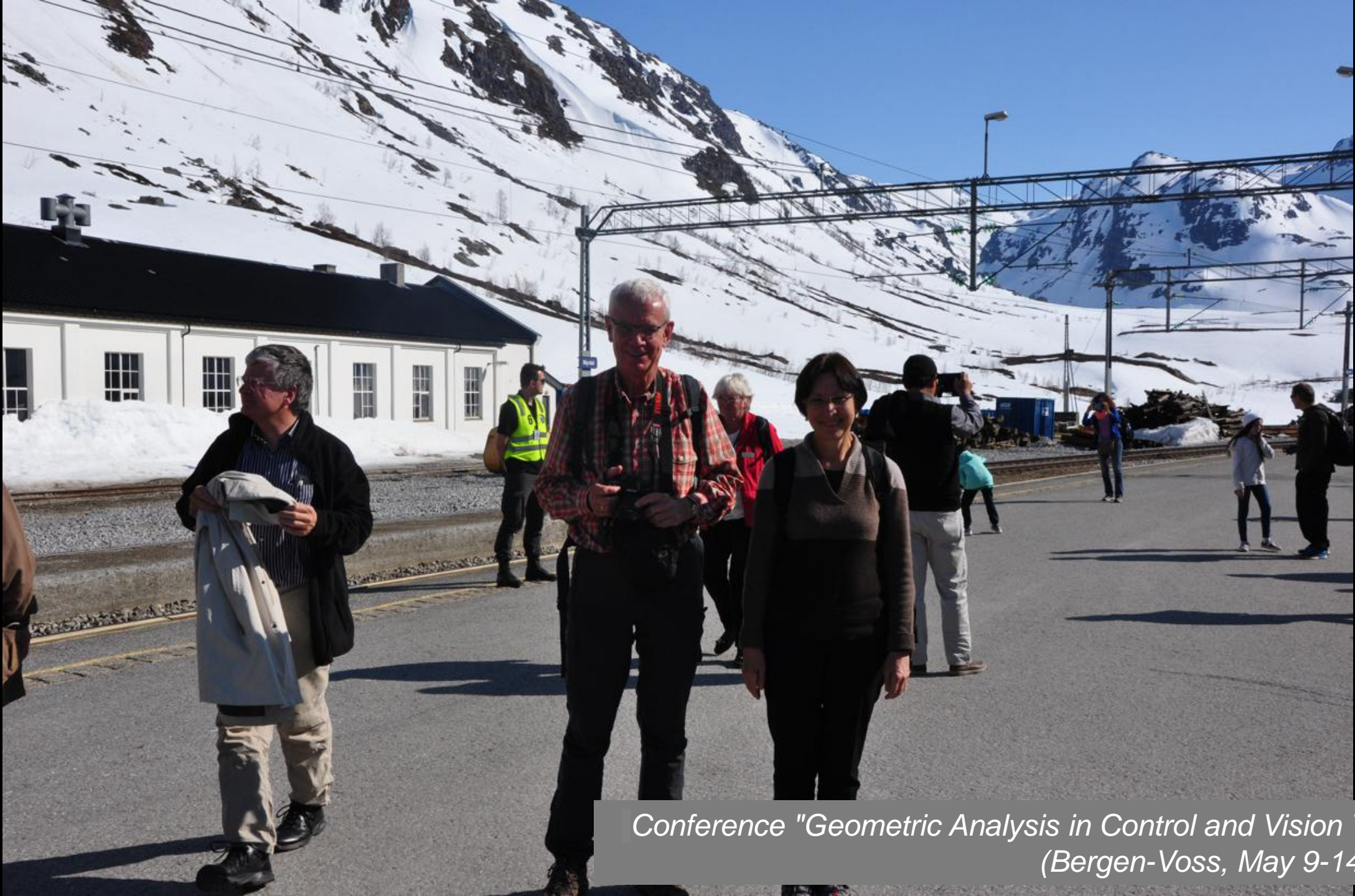
Conference "Geometric Analysis in Control and Vision Theory" (Bergen-Voss, May 9-14, 2016)